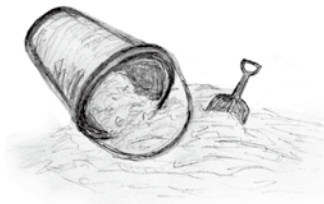
la arena de color crema