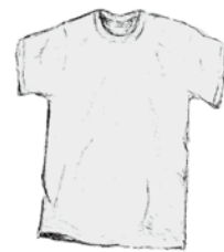
la camiseta de algodón