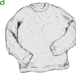
el abrigo de lana