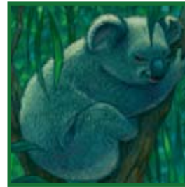
koala Mamífero se alimenta de plantas (herbívoro)