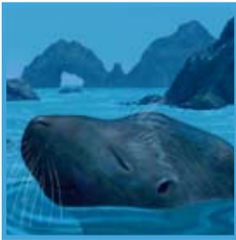
foca Mamífero Se alimenta de peces y otros animales (carnívoro)