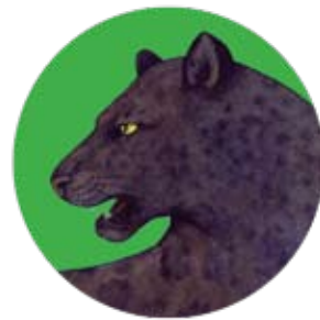
jaguar: Panthera onca