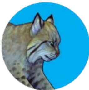
gato montés: Lynx rufus