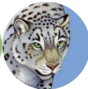
onza: Uncia uncia