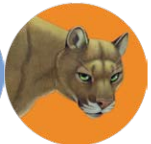
puma: Puma concolor