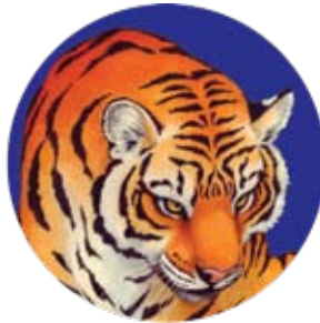
tigre: Panthera tigris