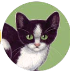
gato doméstico: Felis catus