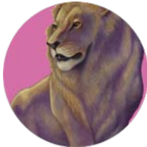
león: Panthera leo