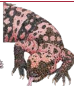
monstruo de gila