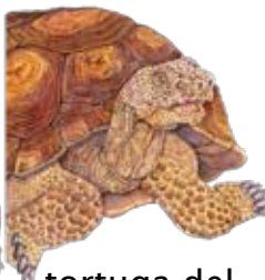
tortuga del desierto