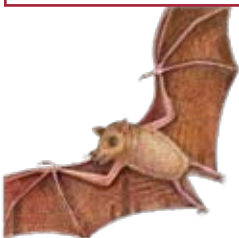
murciélago hocicudo de curazao

6 Yo duermo en una cueva profunda, oscura, de mina, o inclusive en árboles o en rocas agrietadas durante el día caluroso. Salgo de noche (nocturno) cuando hace fresco. Mi lengua larga me ayuda a llegar a lo profundo de las flores del cactus para chupar el néctar que necesito para comer.