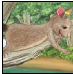
Pósum de cola de escoba