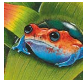
H. las ranas venenosas