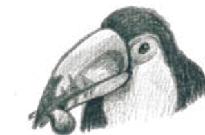
D. Un tucán comiendo