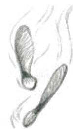
G. Semillas "Whirlybirds" del Arce