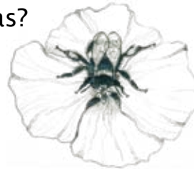
A. Un abejorro en un