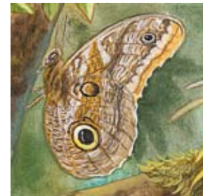
D. las mariposas del búhos