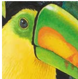
C. los tucanes