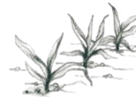
C. Maíz en el campo