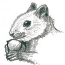
F. Una ardilla con una