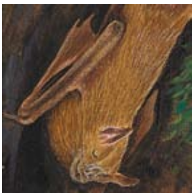
E. los murciélagos