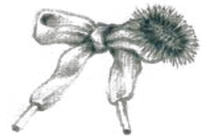
E. Un cardo en una agujeta