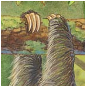
A. los perezosos