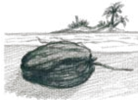
B. Un coco en el