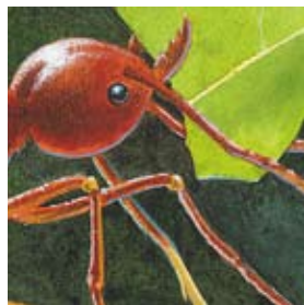
F. las hormigas cortadoras de hojas